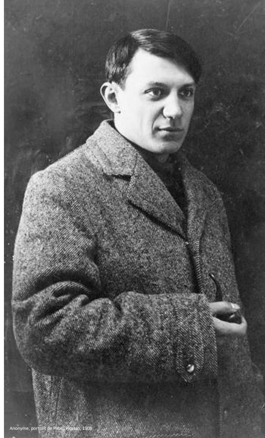
Anonyme, portrait de Pablo Picasso, 1908

En cas de nécessité, des modifications de calendrier, de programme et d'intervenants peuvent survenir.