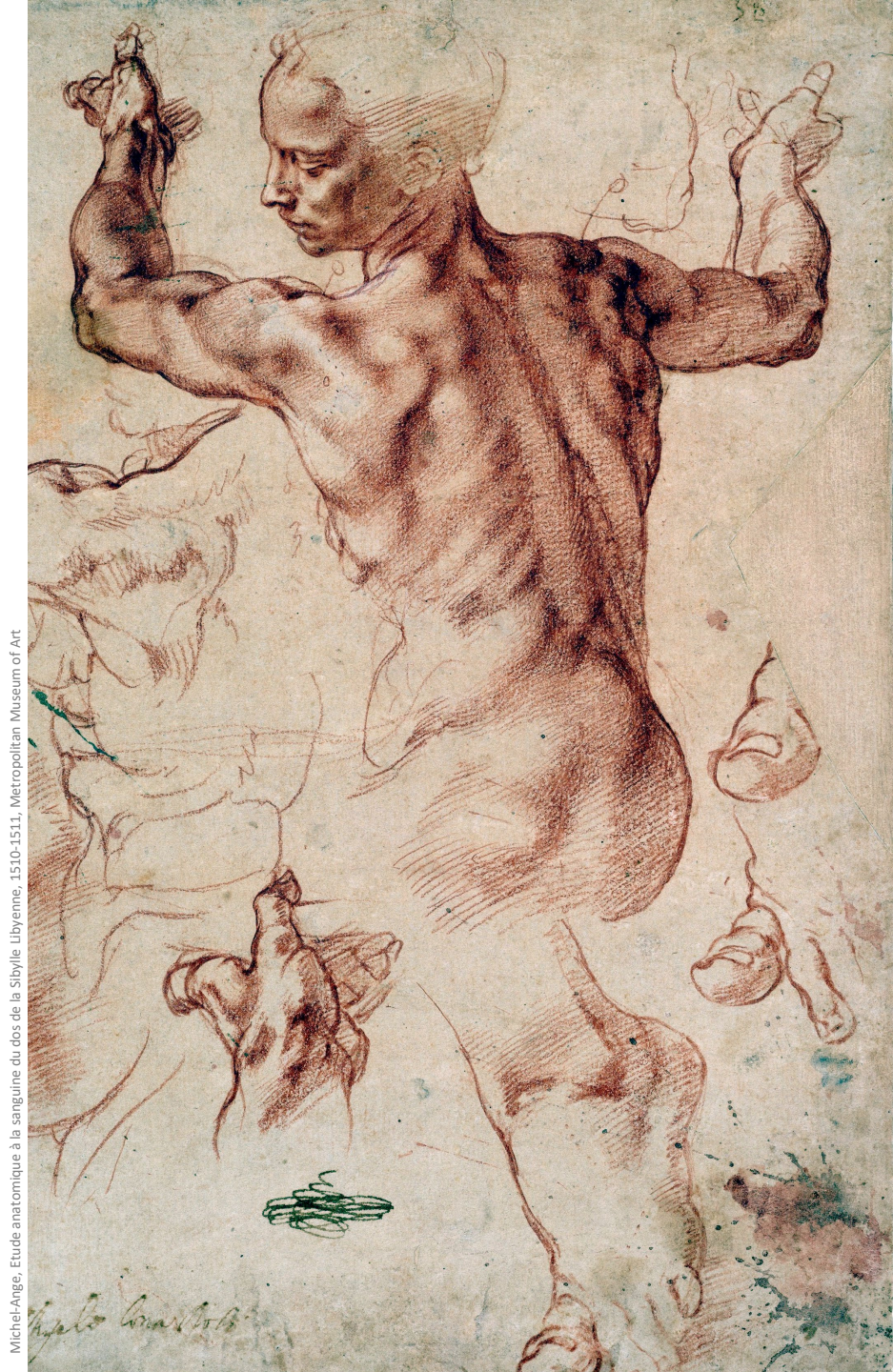
Michel-Ange, Étude anatomique à la sanguine du dos de la Sibylle Libyenne, 1510-1511, Metropolitan Museum of Art

En cas de nécessité, des modifications de calendrier, de programme et d'intervenants peuvent survenir.