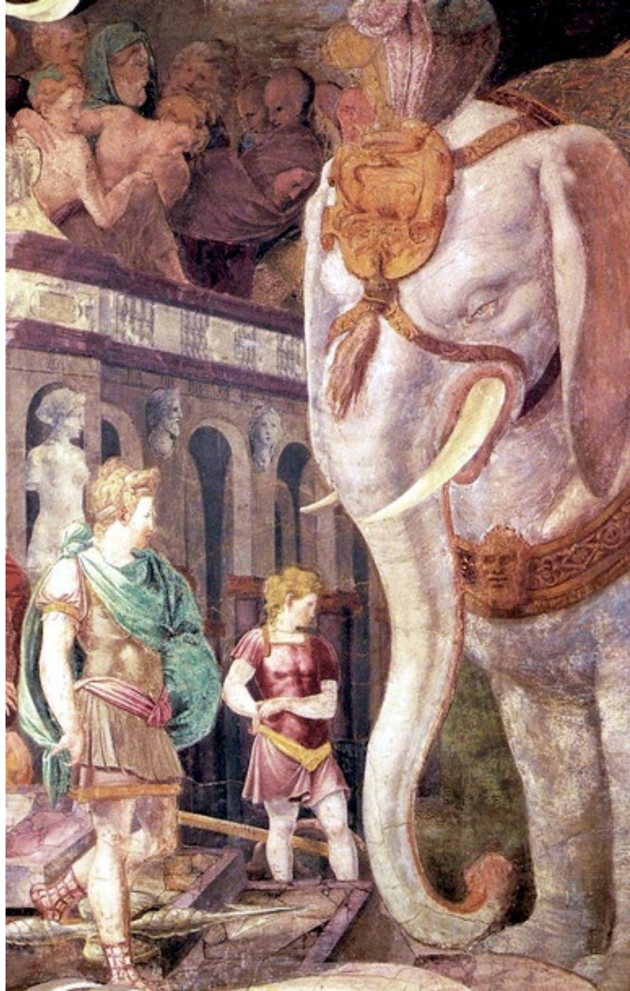
Rosso Fiorentino, Fresque dite de l'éléphant royal, vers 1530, galerie François I er du Château de Fontainebleau

En cas de nécessité, des modifications de calendrier, de programme et d'intervenants peuvent survenir.