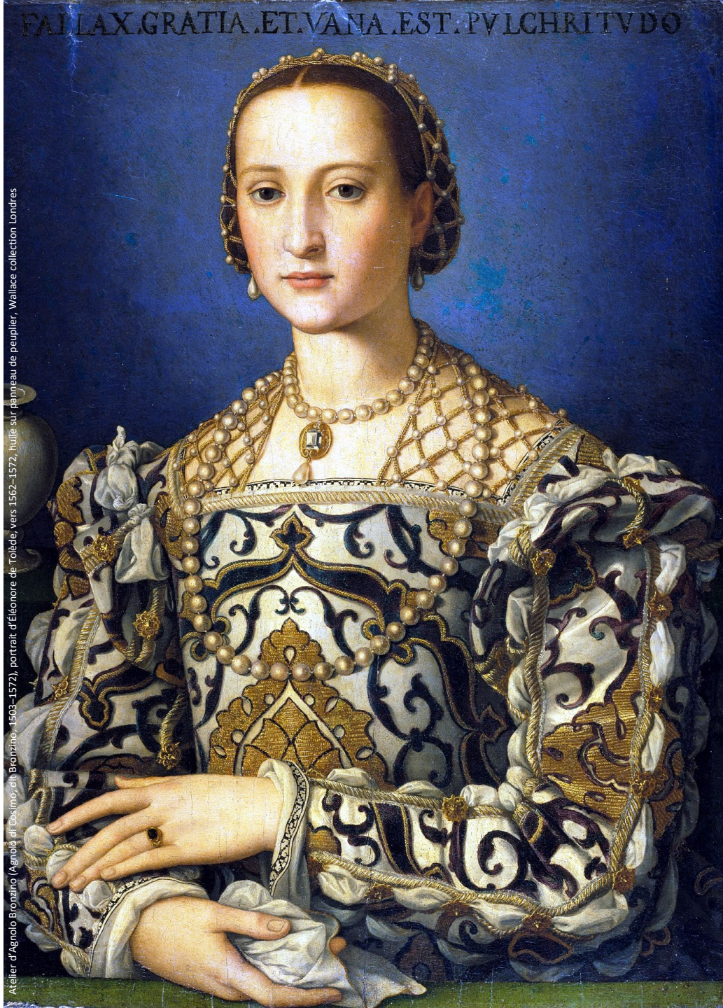
Atelier d'Agnolo Bronzino (Agnolo di Cosimo dit Bronzino, 1503-1572), portrait d'Éléonore de Tolède, vers 1532-1572, huile sur panneau de peuplier, Wallace collection Londres